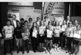
Die Siegerinnen und Sieger 2009:

Büro für Begabtenförderung Kapuzinergasse 1 6900 Bregenz T 05574 4960 236