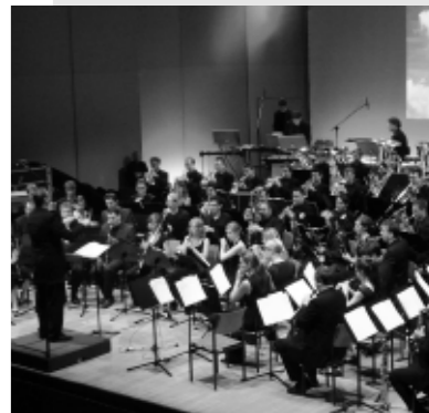
Das Galakonzert des Sinfonischen Blasorchesters liefert den „guten Ton“ zum Schulschluss.